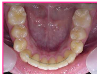
Attelle de contention collée