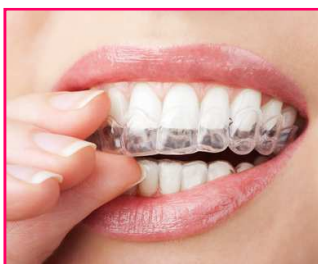
Gouttière de contention